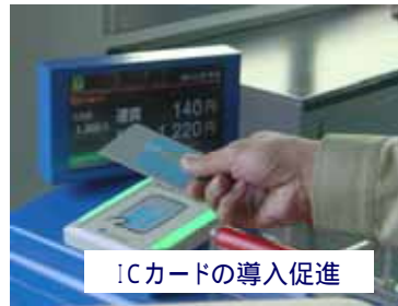
ICカードの導入促進