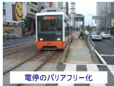
電停のバリアフリー化